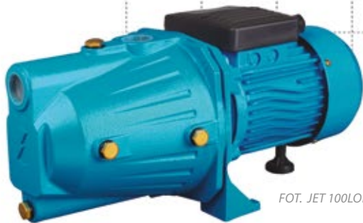
FOT. JET 100LONG