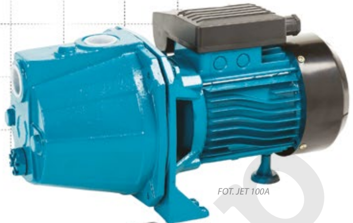
FOT. JET 100A